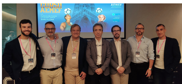
Participantes en la Mesa de Rodilla.

Para el Dr. Valle, la cita congresual de AEMEF representa “un momento de reunión y un foro de debate en el que poder tratar las problemáticas con que nos encontramos en el momento de ejercer nuestra práctica profesional como médico de equipo de fútbol o de club. Hemos comprobado que, en estos encuentros logramos establecer sinergias, vías colaboracionistas o firmar actuaciones conjuntas, todas ellas muy fructuosas.”