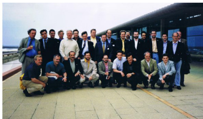
Asistentes al Curso celebrado en Capbreton en 1998