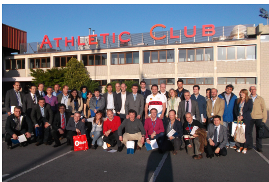
XVII Curso AEMEF en Bilbao en 2013

A pesar de nacer con la intención de celebrarse cada año par en Madrid, la capital madrileña tan solo ha albergado el Curso AEMEF en su primera edición en 1996. En el año 2021, con motivo del XXV Aniversario de la organización de los Cursos AEMEF, la cita congresual de la asociación médica volvió a la Comunidad de Madrid, pero fue la ciudad de Getafe la que acogió la celebración del Curso.