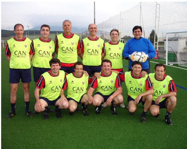
IX Curso AEMEF, Pamplona 2005.