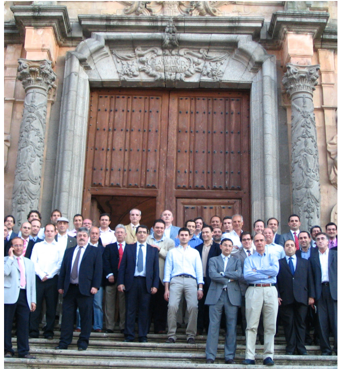
XIII Curso AEMEF celebrado en Salamanca en 2009.