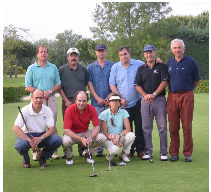
VIII Curso AEMEF. Valladolid 2003.