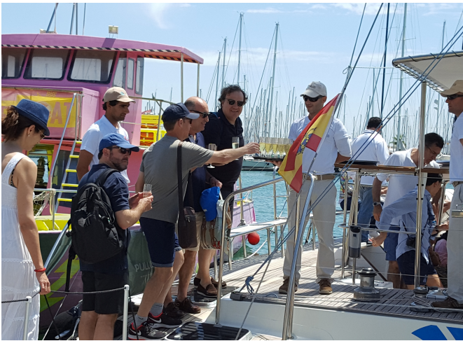
XX Curso AEMEF celebrado en Palma de Mallorca en 2016