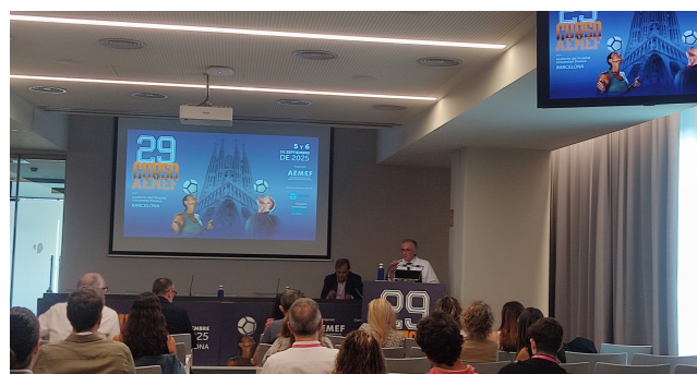
Presentación del XXIX Curso AEMEF