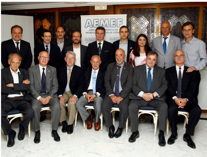
XXV Aniversario de la fundación de la Asociación Española de Médicos de Equipos de Fútbol celebrada en el transcurso del XVIII Curso que tuvo lugar en el mes de mayo de 2014 en Sevilla.