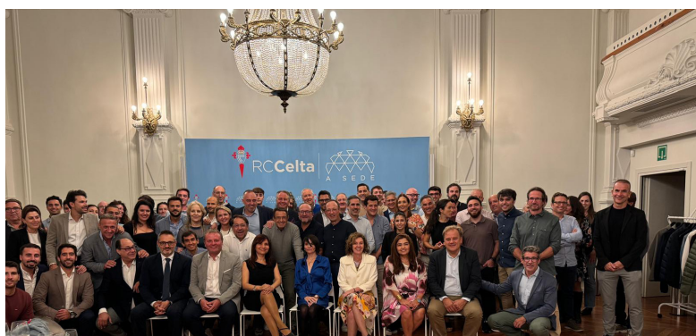
XXVIII Curso AEMEF celebrado en Vigo en 2024.

Valencia con tres ediciones es la ciudad que más veces ha albergado la organización del Curso AEMEF. La ciudad del Turia ha sido sede del encuentro científico formativo médico por primera vez en el año 2001.