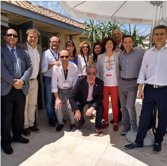
XXII Curso AEMEF celebrado en 2018 en Màlaga.