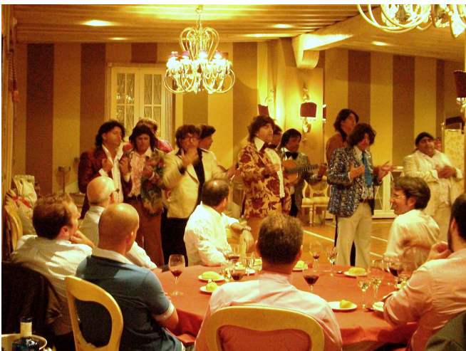
Cena oficial XIV Curso, Cádiz 2010.