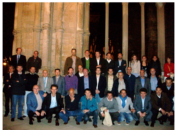
Asistentes XVI Curso, Lleida 2012.