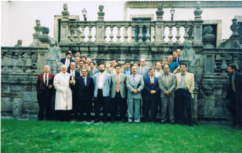
Participantes en el II Curso AEMEF celebrado en el mes de junio de 1997 en A Coruña, tras el inicio de las citas congresuales en Madrid en 1996.