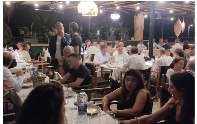
Cena oficial del XXIX Curso AEMEF. Barcelona 2025